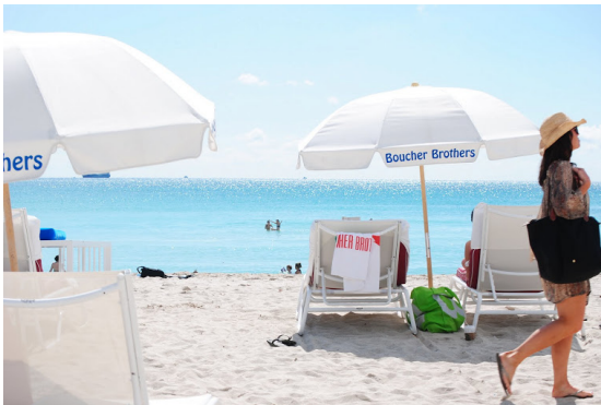
MIAMI South Beach, Florida, 4 maggio 2013