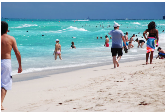
MIAMI South Beach, Florida, 2 maggio 2013