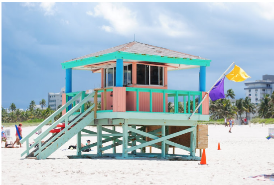
MIAMI South Beach, Florida, 3 maggio 2013