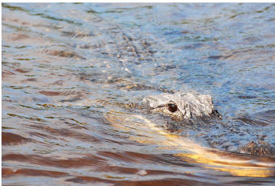
EVERGLADES NATIONAL PARK, KEYS, FLORIDA BAY 1° maggio 2013