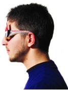
Prototipo finale - Varianti: