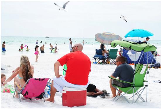
Siesta Beach, Siesta KEY, contea di Sarasota, Florida domenica 29 4 2013